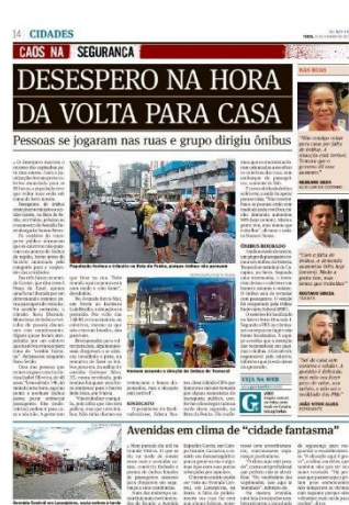
Figura 9, A Gazeta, 07/02/2017

Em várias edições do caderno especial, A Gazeta mesclou informações de utilidade pública com relatos de cidadãos que vivenciavam o período de greve. Todos os dias, o periódico publicava uma lista com estabelecimentos que tiveram sua rotina de abertura e fechamento alteradas pela paralização, além de um panorama da real situação pela perspectiva da população. No caderno apresentado acima, A Gazeta trouxe a fala do então presidente do sindicato dos médicos, além da fala de outros cidadãos que atestavam seus medos em decorrência da greve.