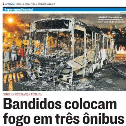
Figura 14, A Tribuna, 14/02/2017

De modo geral, o fotojornalismo busca imagens que ressignificam a matéria. Mais do que complementos, elas servem para contar uma nova história. Por isso, o tamanho e a quantidade de detalhes apresentados em uma imagem, contribuem significativamente para a interpretação dirigida pretendida pelo veículo. (BONI, 2000) Este conceito ficou evidenciado em diversas matérias, inclusive na apresentada anteriormente.