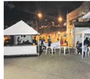
ACESSO ao 7º BPM foi fechado