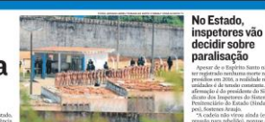
Rebelião em presídio deixa 26 mortos

Alguns presos foram decapitados e outros esmagados por veículos pesados