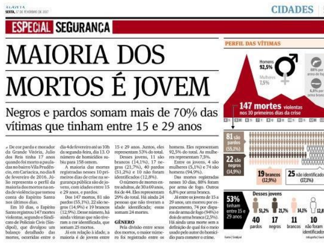
Figura 6, A Gazeta, 17/02/2017

Em relação ao conteúdo apresentado, duas estratégias foram utilizadas por A Gazeta. De um lado, o veículo prestou um serviço informativo de utilidade pública, com matérias que apontavam os estabelecimentos, órgãos públicos e privados e seus respectivos horários especiais de funcionamento. De outro, A Gazeta apresentou as áreas de maior incidência de crimes e ocorrências violentas, em todo o estado. Diariamente, os números de vítimas, os prejuízos para a cidade e para o comércio, eram atualizados em grandes reportagens alocadas em um caderno especial, criado para a divulgação específica de notícias relacionadas ao período, em meia página: