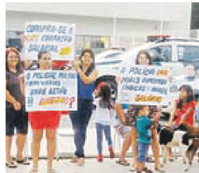
MULHERES na 6ª Cia de Feu Rosa