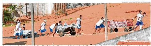
Corpos foram retirados ontem do Presídio Federal de Altoáçua, após 14 horas de rebelião, que só terminou com a entrada de batalhões especiais da polícia