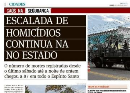
Figura 11, A Gazeta, 09/01/2017 Figura 12, A Gazeta, 08/02/2017

No dia 17 de fevereiro, por exemplo, A Gazeta trouxe uma página com a manchete “Maioria dos mortos é jovem”. Ao lado da manchete, um gráfico com os índices foi apresentado com ilustrações, porcentagens e perfil das vítimas.