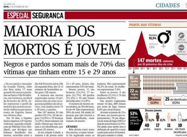
Figura 13, A Gazeta, 17/02/2017

No dia 17 de fevereiro, por exemplo, A Gazeta trouxe uma página com a manchete “Maioria dos mortos é jovem”. Ao lado da manchete, um gráfico com os índices foi apresentado com ilustrações, porcentagens e perfil das vítimas.