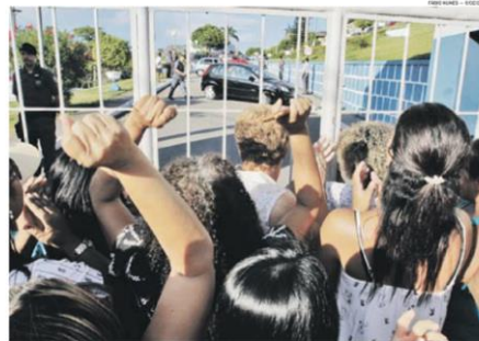
MULHERES EM FRENTE ao Quartel do Comando Geral: nova decisão para identificar e retirar manifestantes

A notificação aos membros do movimento de familiares dos PMs, segundo o magistrado, será feita “com urgência” pelo oficial plantonista, que deverá obter a identificação/qualificação de cada pessoa encontrada no denominado