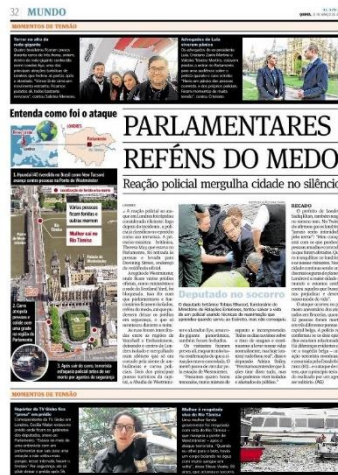
Figura 18, A Gazeta, 23/03/2017

Como apresentado pelas figuras anteriores, tanto quando o assunto era sobre a greve, ou quando se referia a outras questões, a estética adotada por A Gazeta guardou os resquícios editoriais apresentados no mês de fevereiro.