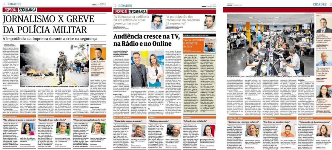
Figura 16, A Gazeta, 12/03/2017

Esta característica de repercussão contínua em assuntos destaque foi muito mais perceptível em A Tribuna do que em A Gazeta, nos meses que antecederam a greve. Entretanto, em março, A Gazeta manteve sua mudança editorial a partir na construção de um conteúdo mais amplo e robusto sobre a violência.