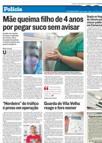
Figura 19, A Tribuna, 16/03/2017

Normalmente, eles se referem a fatos de menor repercussão ou de comoção local, como a manchete divulgada no dia 16 de março: “Mãe queima filho de 4 anos por pegar suco sem avisar” (A TRIBUNA, 2017). Esse tipo de matéria ganha destaque nas manchetes principais, por gerar curiosidade, a partir do estranhamento na interpretação dos fatos.