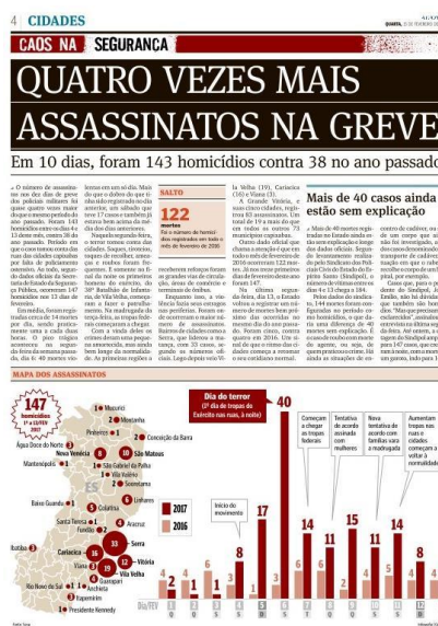
Figura 7, A Gazeta, 15/02/2017