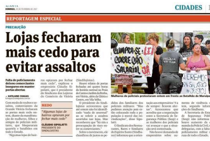
Figura 20, A GAZETA, 05/02/2017

No dia 05 de fevereiro, ainda no início da greve, A Gazeta veiculou uma matéria de meia página para informar à população sobre o fechamento do comércio local. O primeiro parágrafo da matéria trazia: “Falta de policiamento deixou comerciantes inseguros em manter portas abertas”. A matéria não trouxe dados de assaltos que foram executados ou lojas que tiveram portas arrombadas, mas tratou o medo dos comerciantes como possíveis indícios de violência. Dessa forma, a ideia de que violência só deve ser percebida após um ato físico é desconstruída pela abordagem dos jornais durante o período de greve.