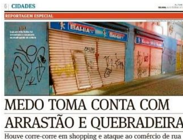
Figura 10, A Gazeta, 06/02/2017

No dia 06 de fevereiro, um dia após o início das paralizações, A Gazeta ainda não havia dado título ao caderno especial. Entretanto, já divulgado de maneira extraordinária, a reportagem intitulada “Medo toma conta com arrastão e quebradeira”, contava com um cabeçalho que a descrevia como “reportagem especial”: