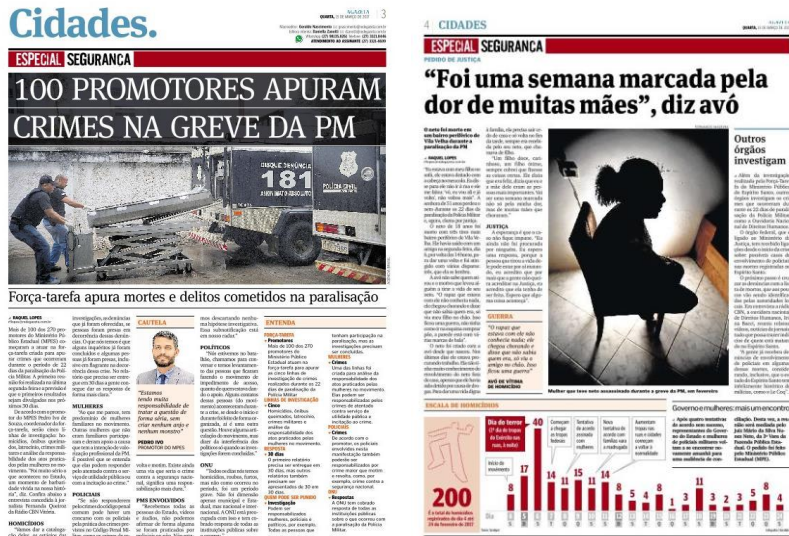
Figura 17, A Gazeta, 15/03/2017

são capazes de pautar a estética dos veículos mesmo depois que chegam ao fim ou mesmo que ele não tenha tradição na divulgação dos referidos tipos de pautas.